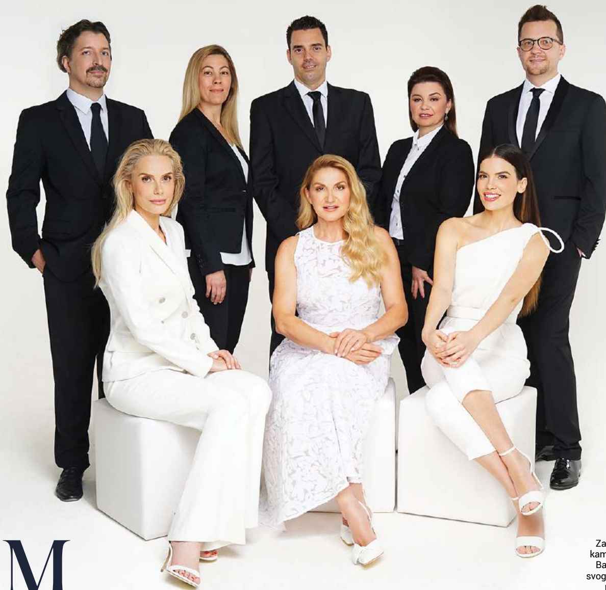
Zaštitna lica nove kampanje Poliklinike Bagatin u društvu svog stručnog tima za pomlađivanje

Upravo zato su ove dame i odabrane kao zaštitna lica nove kampanja za anti-age tretmane Poliklinike Bagatin, gdje vole reći kako su godine samo stanje uma jer se jednako dobro i njegovano može izgledati u bilo kojoj životnoj dekadi