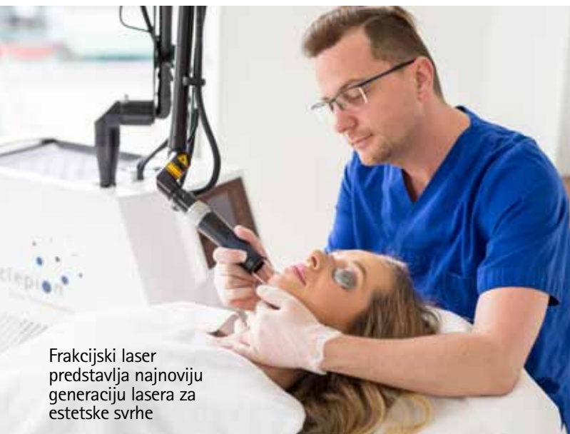
Frakcijski laser predstavlja najnoviju generaciju lasera za estetske svrhe