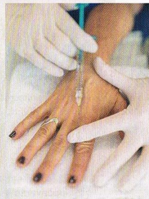
Tretman pomlađivanja ruku