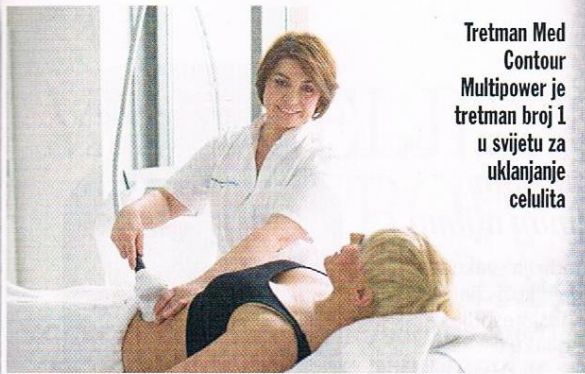
Tretman Med Contour Multipower je tretman broj 1 u svijetu za uklanjanje celulita

Zatezanje kože tijela, redukcija neželjenog, tvrdokornog celulita te smanjenje obujma kritičnih područja postiže se najboljim neinvazivnim tretmanima